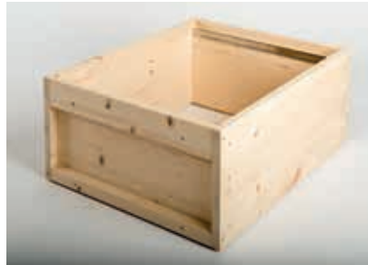
Zarge Zander Fichte