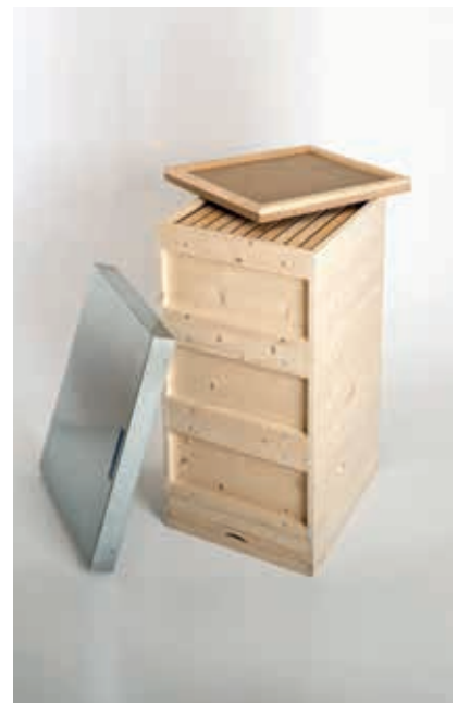
Metalldeckel und Komplettbeute Fichte