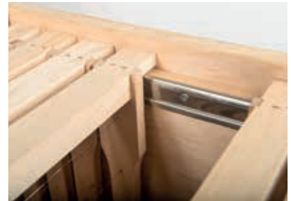
Zarge Zander Weymouthkiefer Detail