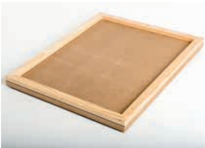
Deckel MDF Fichte